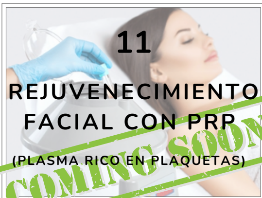
11 REJUVENECIMIENTO FACIAL CON PRP (PLASMA RICO EN PLAQUETAS)

Potente Aliada contra el Acné, prevención de brotes futuros. Reduce el tamaño de los poros, disminuye la hinchazón, ojeras, y mejoran la absorción de productos para una piel más saludable y radiante.