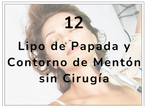
12 Lipo de Papada y Contorno de Mentón sin Cirugía

Utiliza tu propio PRP para estimular la producción de colágeno y desencadenar factores de crecimiento. Rejuvenece tu piel, dejándola visiblemente más joven, suave y saludable.