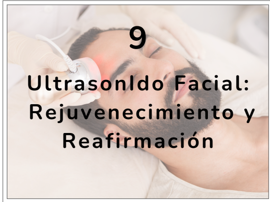
9 Ultrasonido Facial: Rejuvenecimiento y Reafirmación

Además de estimular la producción de colágeno y tensar la piel, elimina la flacidez. Mejora la textura de la piel, suavizando líneas finas y promoviendo una piel radiante rejuvenecida.