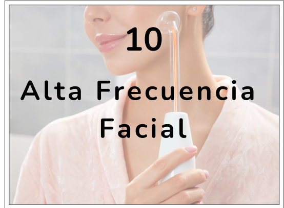
10 Alta Frecuencia Facial

Además de estimular la producción de colágeno y tensar la piel, elimina la flacidez. Mejora la textura de la piel, suavizando líneas finas y promoviendo una piel radiante rejuvenecida.